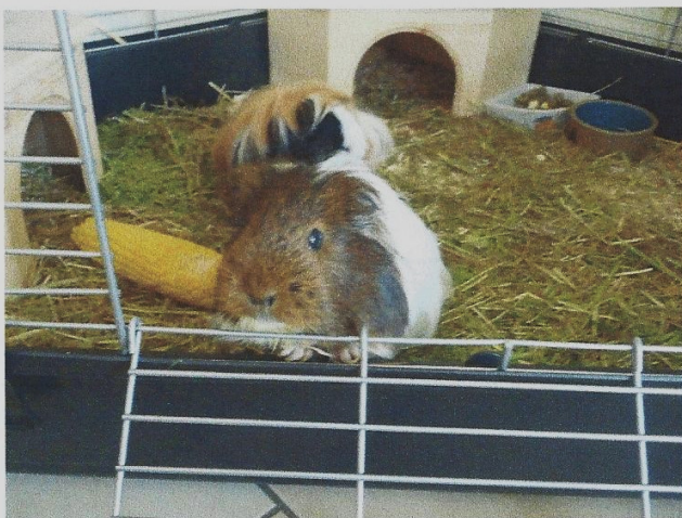
Sie will eine Gurke!

Mein Meerschweinchen heißt Lara sie ist 6 ein halb Jahre alt. Sie hat irgendwann im April Geburtstag. Wir wissen leider nicht wann. Obwohl ein Meerschweinchen nur 5 Jahre kann werden kann das ist einfach nur unglaublich. Sie wiegt 1,3 Kg. Sie ist braun mit weiß gestreift also sie ist vorne an der