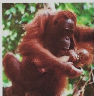
Orang-Utan-Weibchen mit Nachwuchs

Es gibt zwei Arten: Borneo-Orang-Utan und Sumatra-Orang-Utan. Sie halten sich meisten in den Bäumen auf. Sie sind vorwiegend Pflanzenfresser und ernähren sich von reifen Früchten, Blättern und Blüten. Sie können aber auch tierische Nahrung zu sich nehmen, wie Insektenlarven, Honig und Vogeleier. Im Vergleich zu Schimpansen und Gorillas leben die Orang-Utans nicht in Gruppen sondern sind eher Einzelgänger. Dauerhafte Bindungen gibt es nur zwischen einer Mutter und ihrem Nachwuchs.